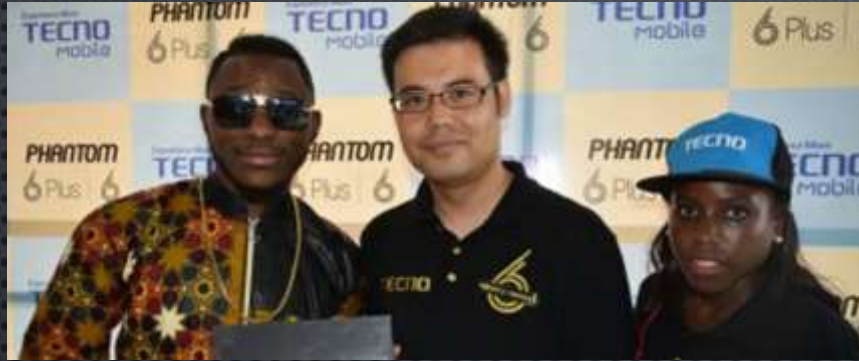
DYNASTIE LE TIGRE & TECNO