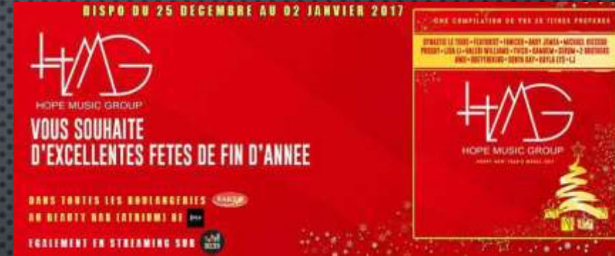
HMG & BOULANGERIES SAKER PROJET : HNY DECEMBRE 2016