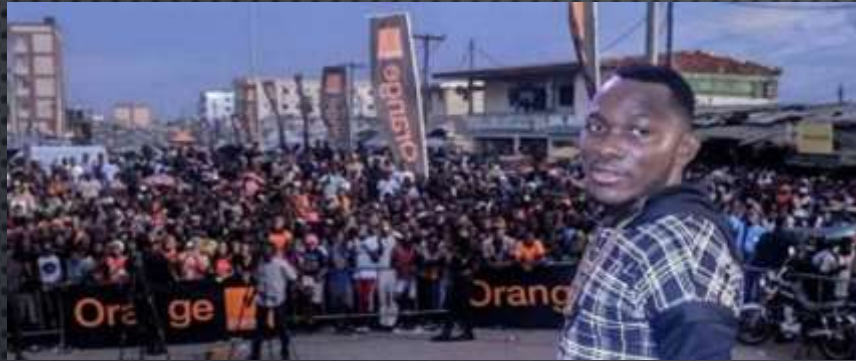
DYNASTIE LE TIGRE & ORANGE EVENT : FREE CORPORATE LIVE CONCERT