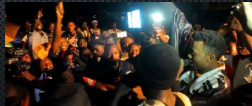
FEATURIST & ORANGE EVENT : ORANGE 3G+ LAUNCHING