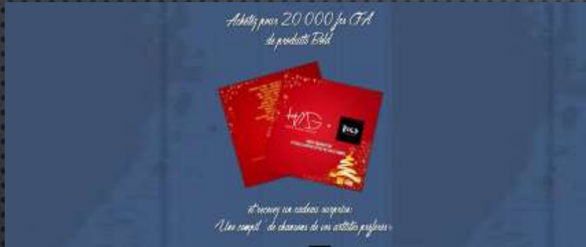
HMG & BOLD MAKE UP PROJET : HNY DECEMBRE 2016